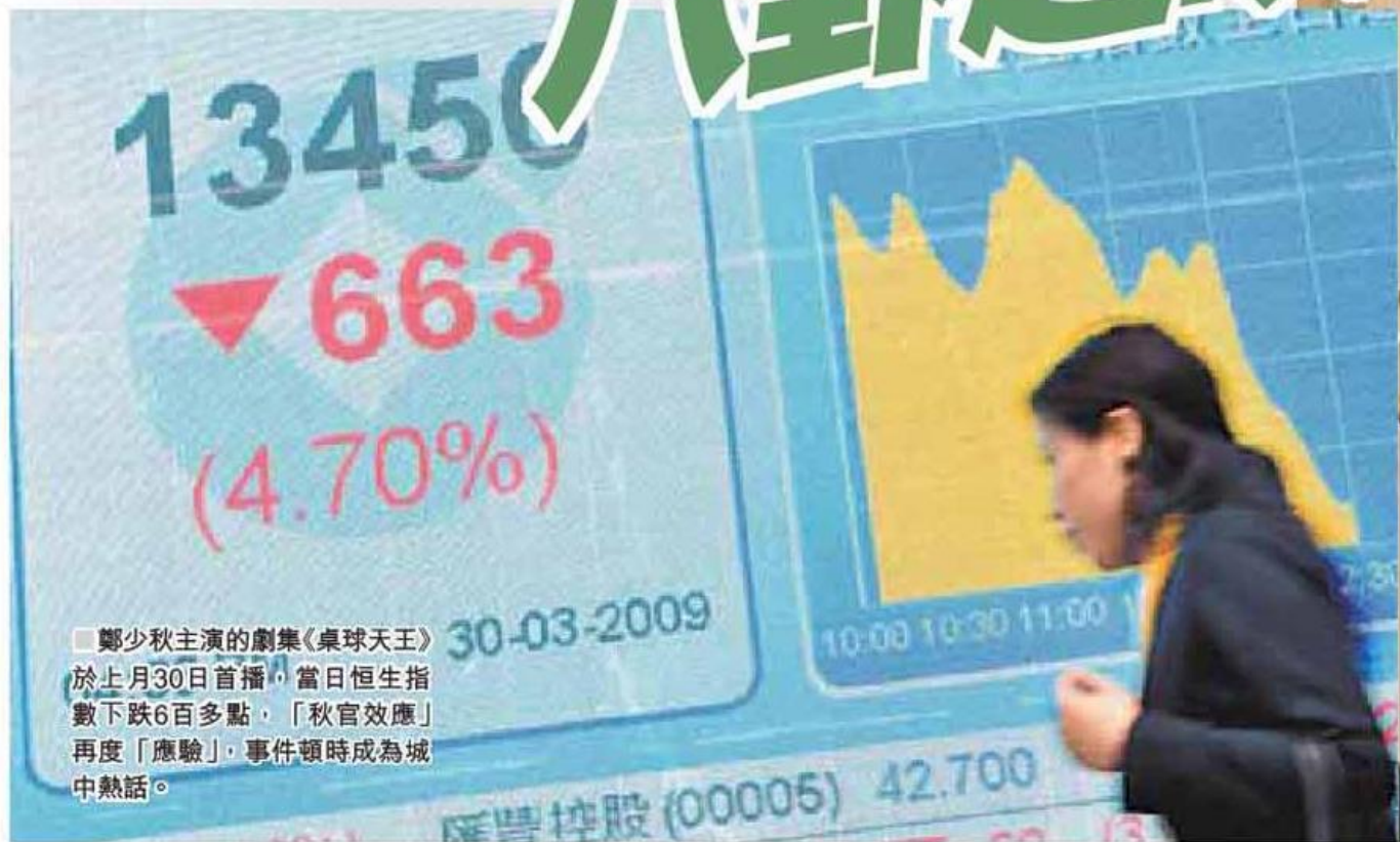
■鄭少秋主演的劇集《桌球天王》於上月30日首播，當日恒生指數下跌六百多點，「秋官效應」再度「應驗」，事件頓時成為城中熱話。