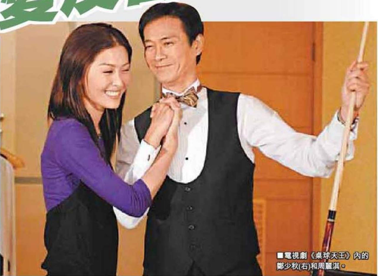
■電視劇《桌球天王》內的鄭少秋(右)和周麗淇。