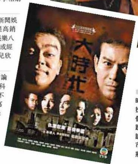
■1992年電視劇《大時代》首播，鄭少秋扮演丁蟹，恒指在一個月內從6,400點下跌至5,000點。由於該劇故事恰巧以股票市場為背景，故坊間將兩者聯繫起來。