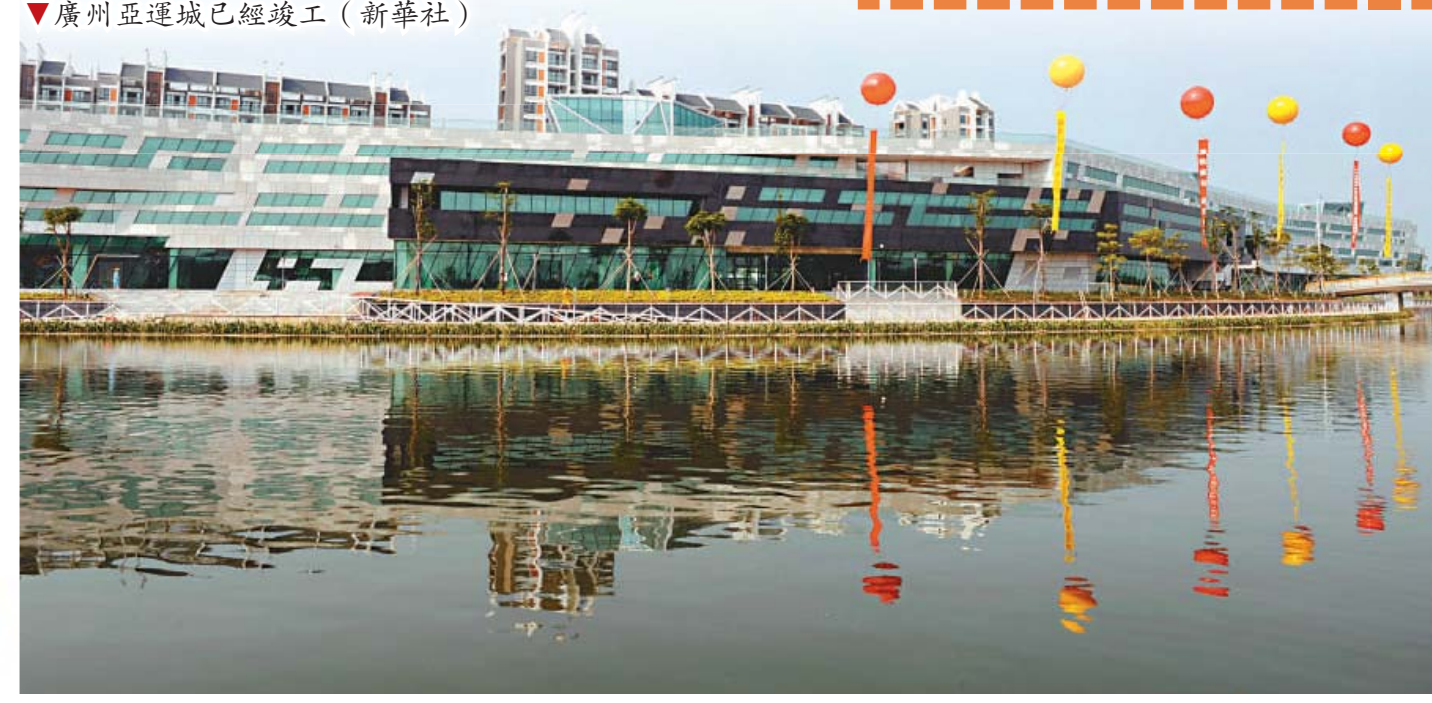
▼廣州亞運城已經竣工