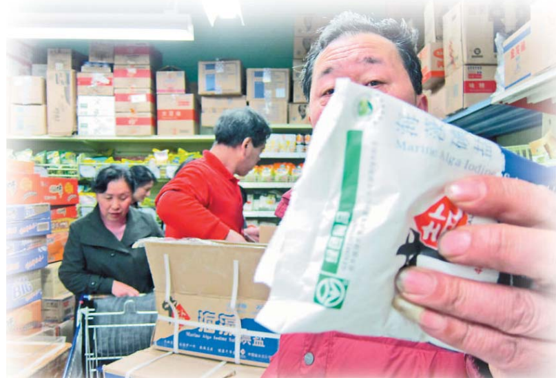
日本發生核輻射洩漏危機後，內地出現搶鹽潮，圖為上海民衆在超市買鹽

不過，奶粉有別於鹽，那是嬰兒的必需品，「廿四孝父母」搶購是爲了愛護孩子，可以理解。鹽雖是日常生活必需品，但只作調味之用，市民