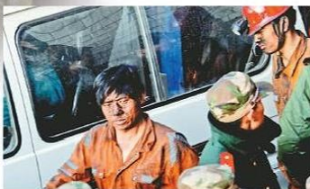
中國近年礦難頻生。圖為河南伊川礦難的救援人員

中國礦工數以百萬計，單是煤炭大省黑龍江，就有30多萬人從事煤炭開採工作，多數是農民工。不少人寧願選擇下井「掙大錢」，都不甘心在「地面」當一輩子苦力，在礦場做記錄員每月有2000元人民幣（下同）工資，但下井就有3000多元一個月。有礦工稱，部分礦長一年薪金高達60萬元，隨時還比辦公室文職