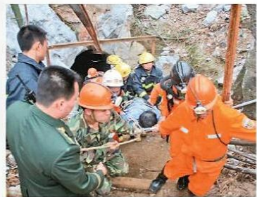
中國礦難的死亡率是世界平均水平的百多倍。圖為救援人員搶救井下被困礦工