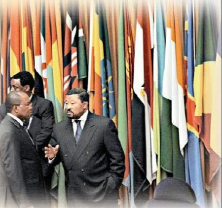
非洲聯盟（非盟）委員會主席讓·平（右）在非盟執行理事會第16屆常會上與代表交談